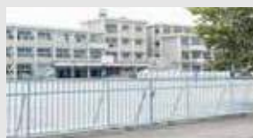
陽南中学校 徒歩5分(約360m)