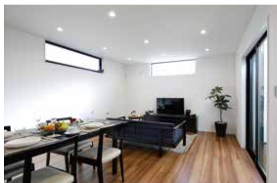
※平成30年12月現地撮影。

家事動線の良い「奥様目線のプラン」。リビングから見える中庭で毎日の中に癒しをプラス。収納もたっぷり毎日のキレイが続きます。