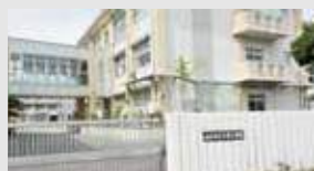
三里小学校 徒歩8分(約600m)