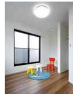
※平成30年12月現地撮影。