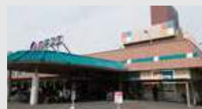
カネスエ 徒歩2分(約130m)