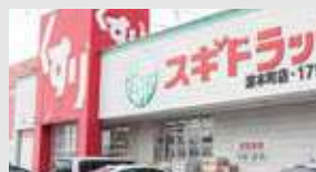
スギ薬局 徒歩3分(約240m)