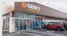
ゲンキー 徒歩2分(約130m)