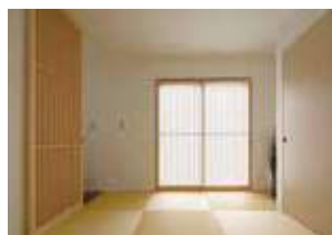
※平成30年12月現地撮影。