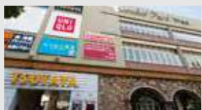
オーキッドパーク 徒歩7分(約560m)